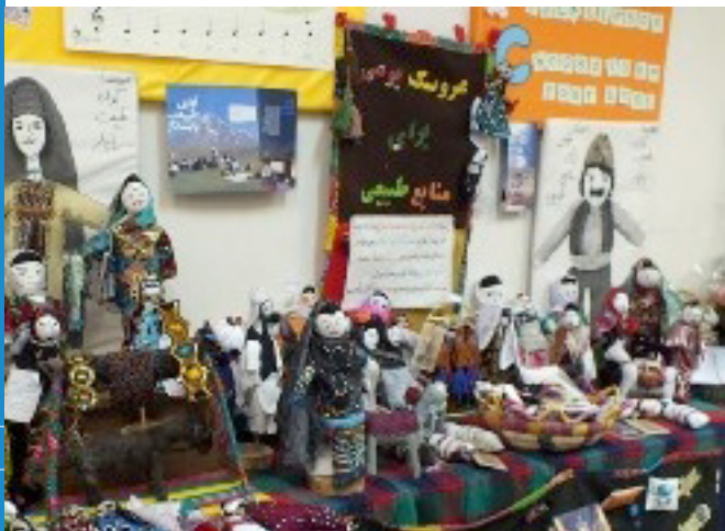
نمایشگاه عرضه عروسک‌ها و صنایع دستی محلی

۸- اعضای گروه باید با روش‌های ارزیابی مشارکتی آشنا باشند تا هر مدت یکبار برای بهبود مستمر فعالیت‌های خود به ارزشیابی فعالیت‌های صورت گرفته و اصلاح امور بپردازند.